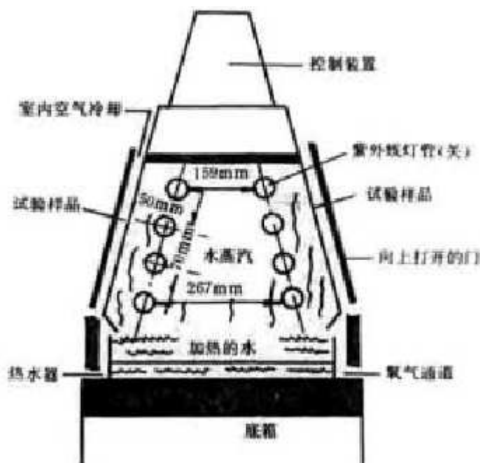
图 1 荧光紫外线/冷凝试验箱结构截面图

3.1.1 试验箱的结构由耐腐蚀金属材料制成，包含 8 支荧光紫外灯，盛水盘，试验样品架和温度、时间控制系统及指示器（见图 1）。