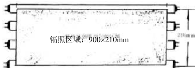
图 2 试验箱均匀辐照区域的范围

3.1.2 荧光紫外灯应快速启动，灯管功率为 40W，长度为 1220mm，试验箱均匀工作区域的范围为 900×210mm（见图 2）